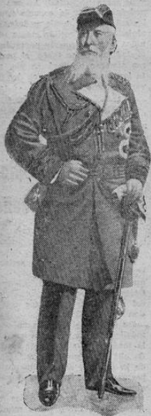
Almirante Alfredo Von Tirpitz cuyos funerales se verificaron hoy en Munich, y sobre cuyo ataúd fue colocada la antigua bandera imperial, la espada y sombrero del Almirante