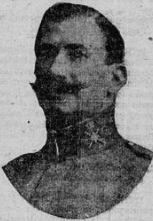
General Dámaso Berenguer

Nadie negará las buenas intenciones, el talento y el patriotismo del marqués de Estella, y estoy convencido de que todos, absolutamente todos, reconocerán los grandes servicios que ha prestado a la Patria. Desde luego, todo lo humano es imperfecto, y el mismo marqués de Estella comprenderá a estas horas que una dictadura prolongada indefinitivamente no conduce a ninguna parte. Aunque los Gobiernos fuertes y estables resulten indispensables para la tranquilidad y el bienestar de los países, ya no es posible volver a la autocracia, prescindiendo de la voluntad del pueblo. El Parlamento que se elija con un sistema o con otro, ya no puede faltar de la vida nacional, y por esta razón el punto fundamen-