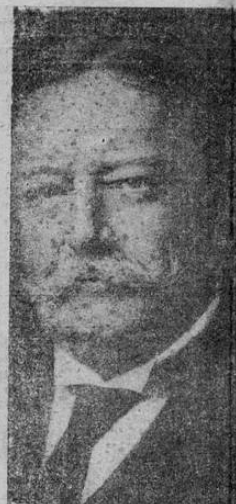
Mr. W. H. Taft, ex-presidente de los Estados Unidos de Norteamérica y de la Corte Suprema de Justicia de aquel país, quien falleció el último sábado en su residencia de Washington, y a quien el gobierno de Costa Rica, para honrar su memoria, ha decretado hoy tres días de duelo nacional ordenando sea izado el pabellón tricolor en todos los edificios públicos y guarniciones militares de toda la República.

Bien hace el Poder Ejecutivo en honrar la memoria de los que con nuestra patria fueron siempre justos y nobles